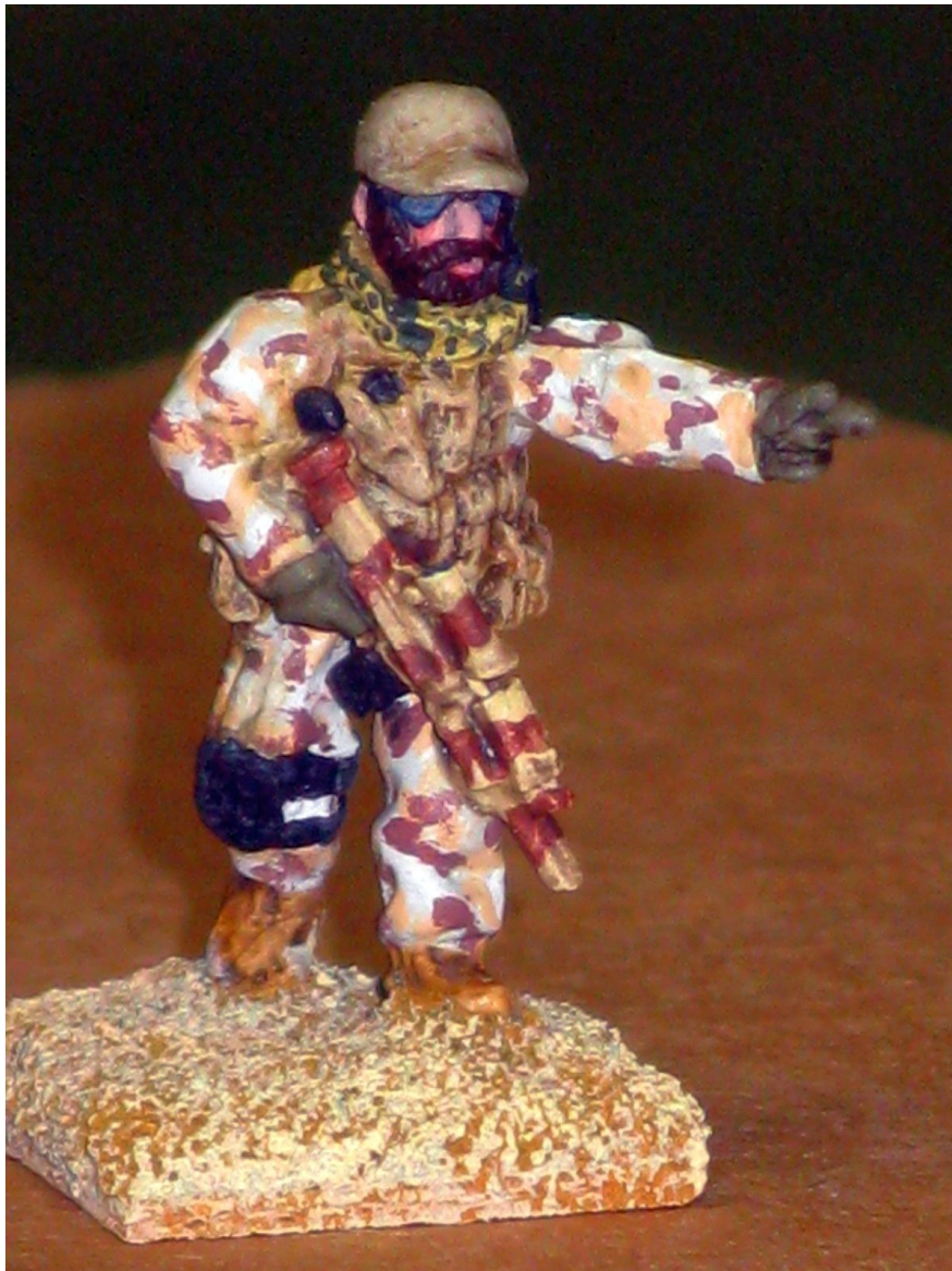
20mm in metallo della Elhiem Figures

Il colore delle uniformi varia in funzione dell’usura e dell’esposizione agli agenti atmosferici; quindi non preoccuparsi troppo dell’esatta rispondenza dei colori.